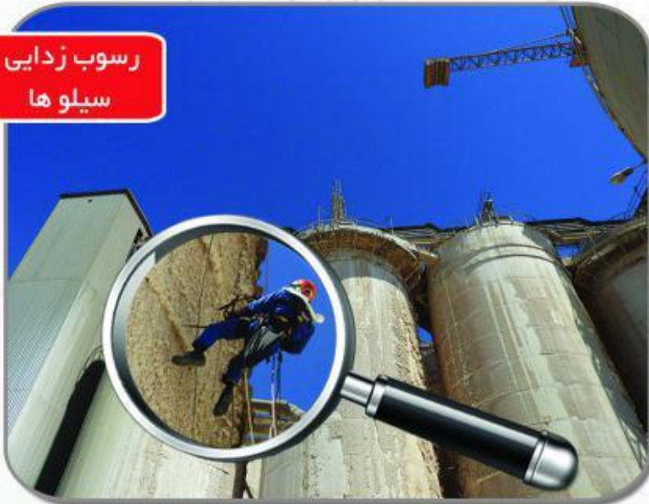
رسوب زدایی سیلوها