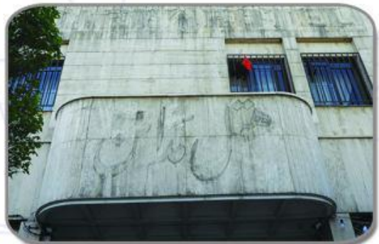
بعد از سند بلاست