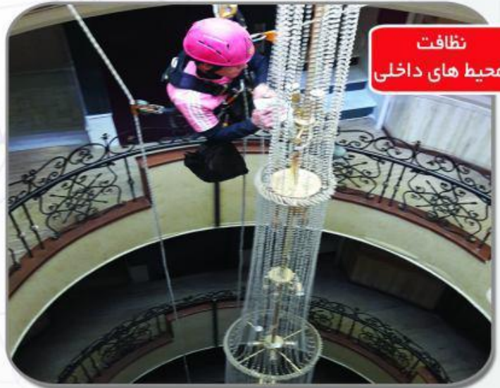
نظافت محیط های داخلی