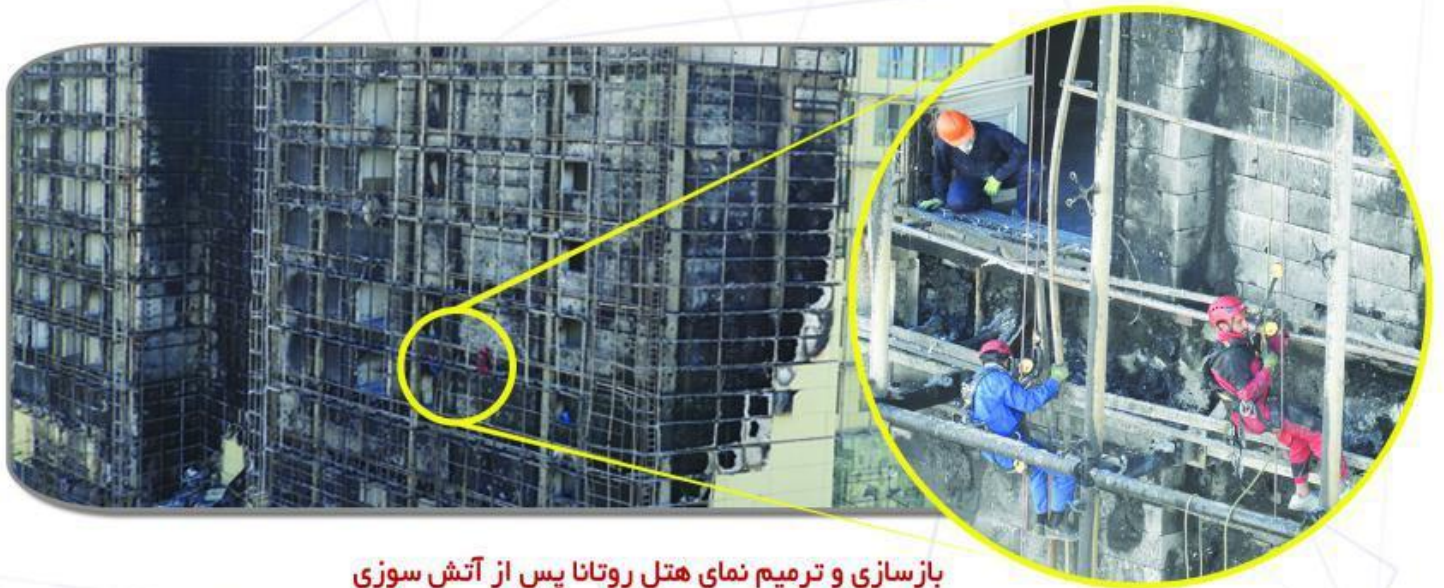
بازسازی و ترمیم نمای هتل روتانا پس از آتش‌سوزی

امروزه متاسفانه برج‌ها و ساختمان‌های زیادی به علت حوادث غیرمترقبه‌ای مانند آتش‌سوزی یا زلزله، دچار آسیب جدی می‌شوند. خوشبختانه تکنیک دسترسی با طناب به علت سرعت عمل بالا، شرایط بازسازی را آسان‌تر کرده است.