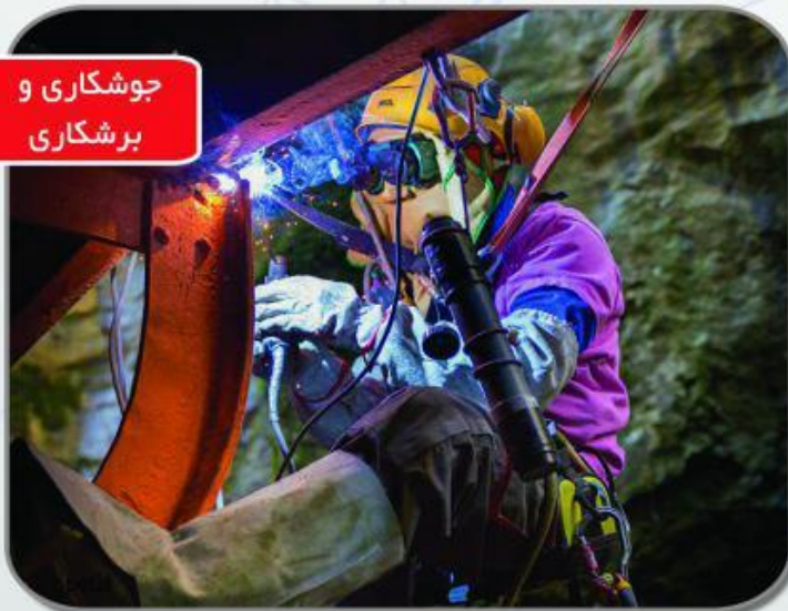
جوشکاری و برشکاری