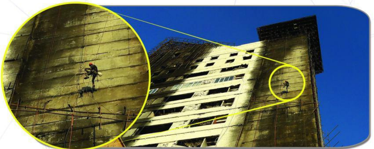
بازسازی و ترمیم نمای برج سلمان پس از آتش‌سوزی